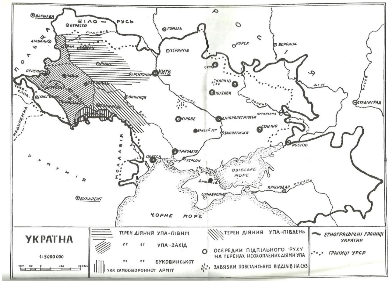
Карта дії Української повстанської армії та підпілля ОУН. URL: https://ounuis.info/collections/maps/1002/karta-dii-ukrainskoi-povstanskoi-armii-ta-pidpillia-oun.html (дата звернення - 02.12.24)