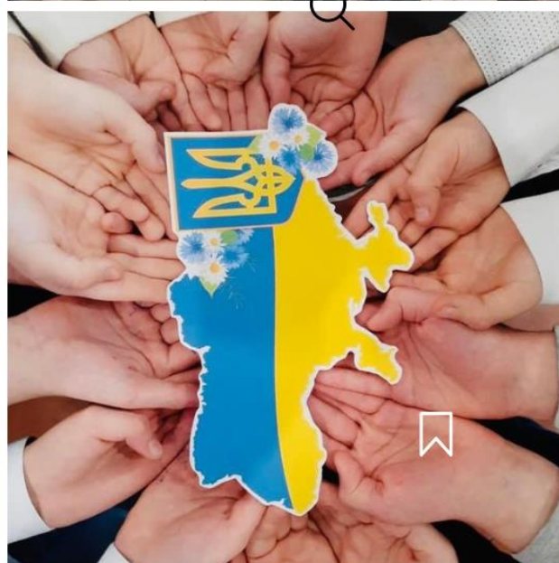
Класний керівник Шевчик В.І разом з учнями Полонського ліцею №1