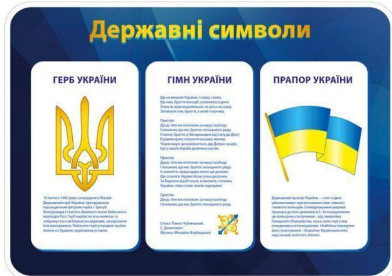
Державні символи України