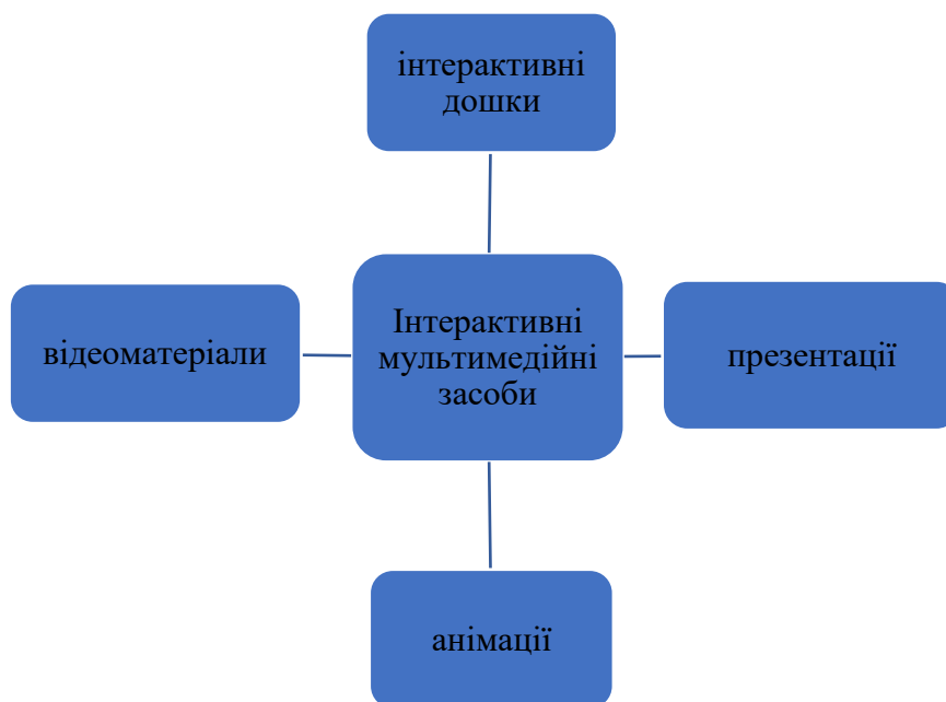
Інтерактивні мультимедійні засоби