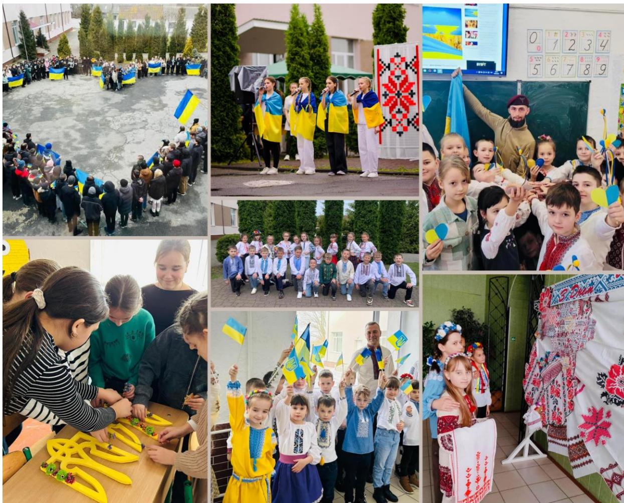
Учні Полонського ліцею №1 під час заходів з патріотичного виховання