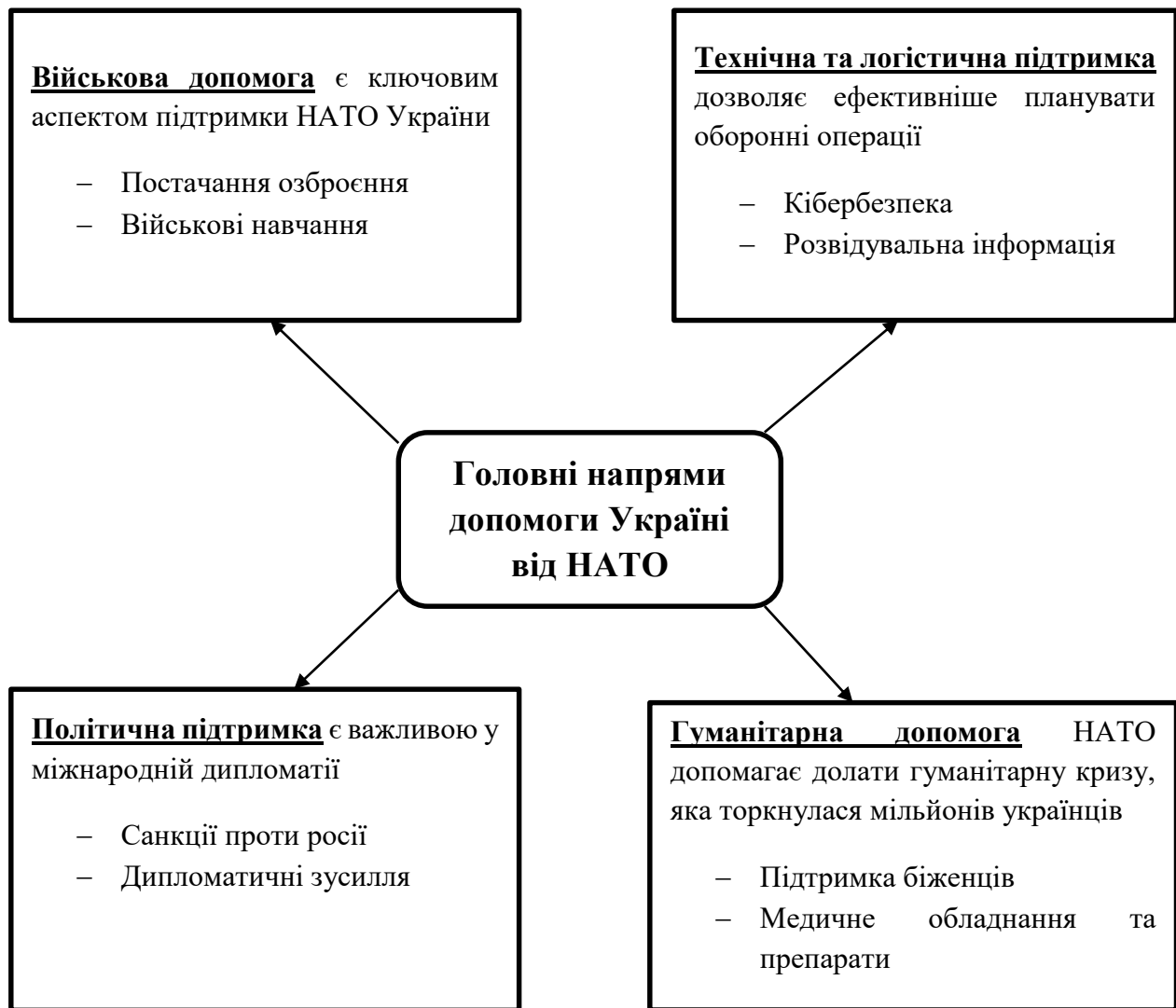
Рис.2.1. Головні напрями допомоги Україні від НАТО[8]

Генеральний секретар НАТО Єнс Столтенберг підкреслив, що Альянс відчиняє двері для України, однак процес прийняття нових членів залежить від рішення всіх країн-членів. Український уряд вважає, що держава вже значною мірою досягла стандартів НАТО, залишивши лише формальні процедури. Україна прагне вступити до НАТО через прискорений процес, за прикладом Фінляндії та Швеції. На саміті НАТО 29 червня 2022 року було офіційно запрошено Швецію та Фінляндію приєднатися до Альянсу без Плану дій щодо членства, а 4 квітня 2023 року Фінляндія вже стала членом НАТО. Швеція ж отримала згоду парламентів Туреччини та Угорщини на вступ [8].